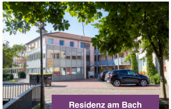
Residenz am Bach

Für die ältere Generation ist mit dem Kreissenorenheim im ehemaligen Jagdschloss in Oesterholz-Haustenbeck, einer Seniorenresidenz „Wohnen am Schlänger Bach“, einem Seniorenwohn- und Pflegeheim (Diakonis) mitten im Ortskern sowie barrierefreien Wohnungen und natürlich genügend Ärzten, Apotheken, Pflegediensten und Seniorengruppen bestens gesorgt.