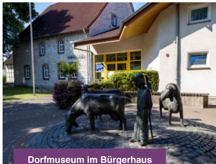
Dorfmuseum im Bürgerhaus

Ansprechpartner: Reinhard Fleege-Althoff Tel.: 05252 / 7698