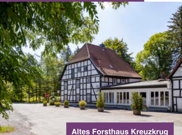
Altes Forsthaus Kreuzkrug